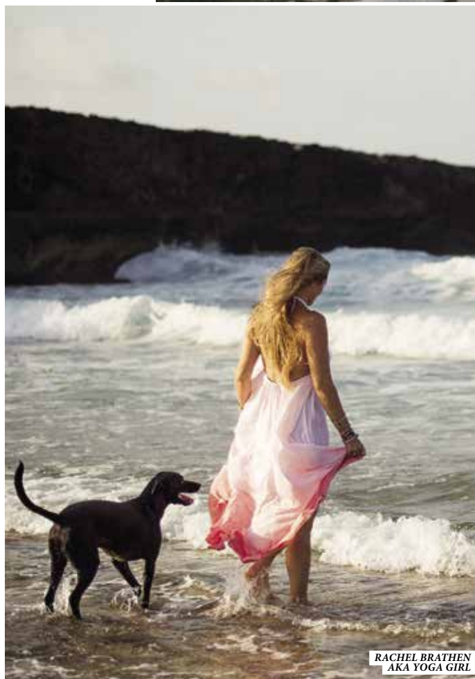
RACHEL BRATHEN AKA YOGA GIRL