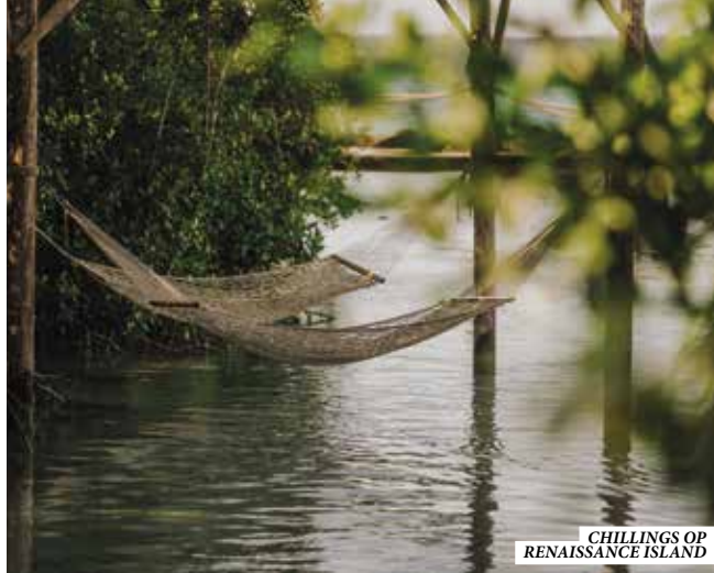
CHILLINGS OP RENAISSANCE ISLAND