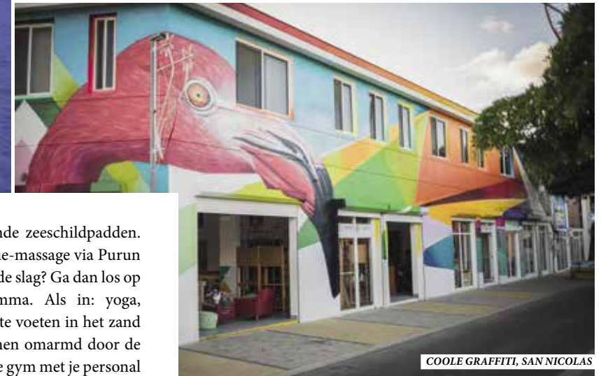
COOLE GRAFFITI, SAN NICOLAS