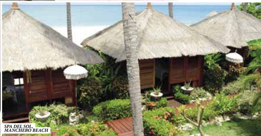
SPA DEL SOL MANCHEBO BEACH