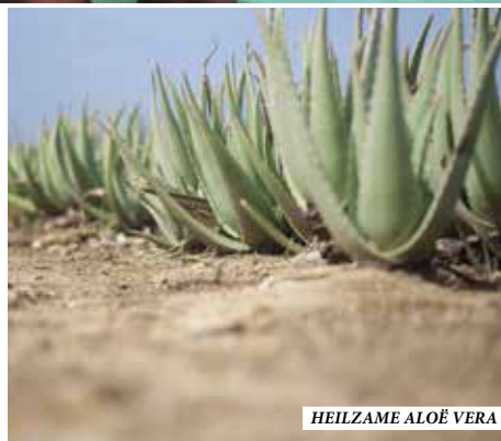
HEILZAME ALOË VERA