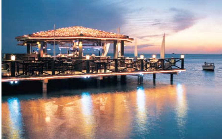
Pinchos-restauranten er et fantastisk sted at spise og se solen forsvinde i havet