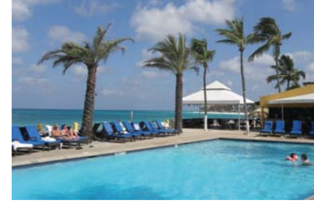
Mange hoteller ligger direkte ned til Arubas prægtige strande, så swimmingpools og hav går nærmest i ét.

I højsæsonen for besøg af de store skibe – oktober-april – kan der være op til 10.000 krydstogtskæster på øen dagligt, og det gør ganske enkelt en visit i Oranjestad uudholdelig. Langt de fleste tager til Oranjestad for at shoppe. Og det vil være en stor fejl ikke at besøge Aruba Aloe Vera-virksomheden i udkanten af byen. Siden 1890 er aloe-planten