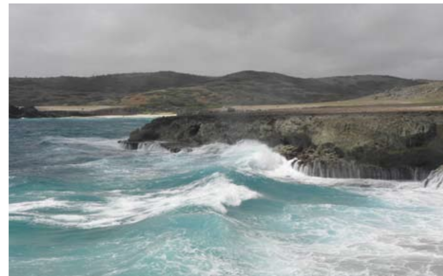
Havet kan være barskt sine steder.

indflydelse – Venezuela er kun 24 km væk – og den afrikanske slavefortid. I byen er der et lokalt liv, og der er dermed ikke kun tale om en by, som baserer sig på turisternes gøren og laden. Undgå at besøge byen, når de store krydstogtskibe er der (typisk mellem kl. 10 og 17).