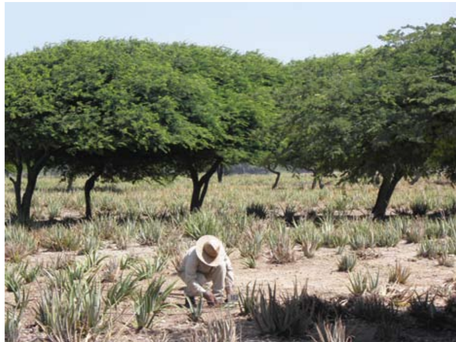
Husk at købe Aloe Vera-produkter med hjem. Her dyrkning i nærheden af virksomheden.

Når daselivet ved stranden har taget overhånd - og solskoldningerne er blevet for mange, bør man unde sig selv et besøg i Oranjestad, øens fine hovedstad med ca. 27.000 indbyggere. Her kan man opleve hollandsk bygestil, men samtidig ane både spansk